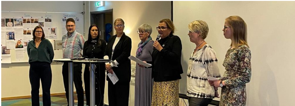
Avdelningsstyrelsen vid årsmötet 2022

Vill rikta ett varmt tack till alla livsviktiga medlemmar i Norrbotten – tillsammans med alla er blir vårt fackliga arbete fullt av både kraft, energi och mening!