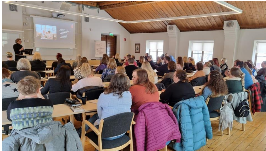
Utbildning för lokalt förtroendevalda

Att ytterligare betona för arbetsgivarna vikten av välutbildade förtroendevalda/skyddsombud och utifrån det argumentet kunna behålla de heldagsträffar med utbildning för FV som vi återupptagit efter pandemin. Innehållet i dessa har bland annat varit samverkan, MBL, förhandling och HÖK-22. Med ökade kunskaper förbättras allas vår arbetsmiljö och patientsäkerheten säkerställs. Detta är grunden i den svenska modellen, partssamverkan. Alla arbetsplatser får en bättre arbetsmiljö och vårdmiljö om detta uppnås.