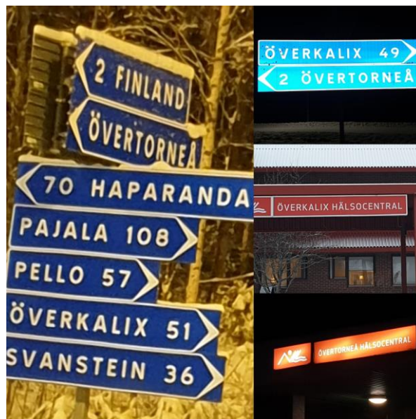
Glesbygdsturné i länet